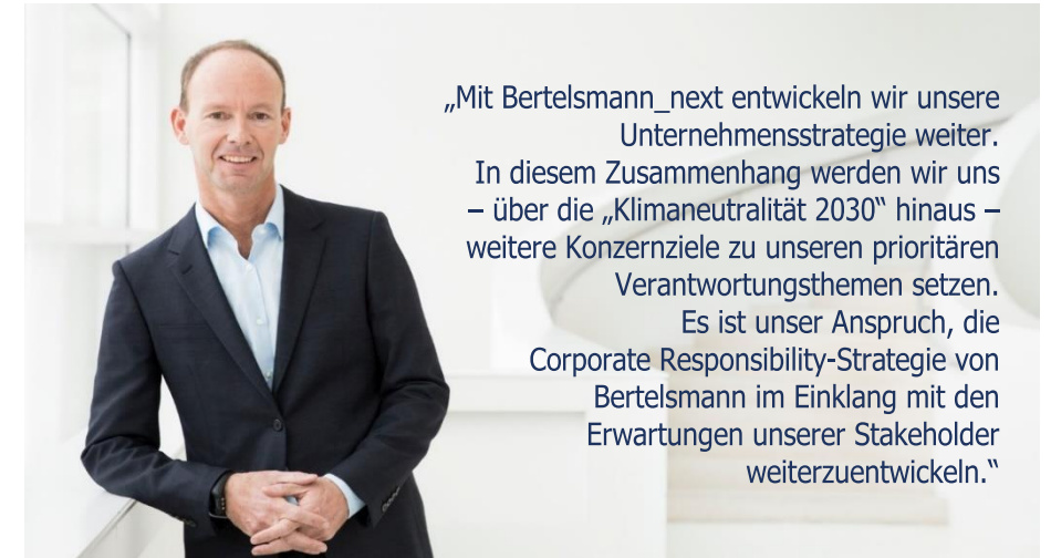
Thomas Rabe Vorstandsvorsitzender von Bertelsmann SE & Co. KGaA und Chief Executive Officer der RTL Group

Bertelsmann veröffentlicht jährlich eine Nichtfinanzielle Erklärung zu relevanten CR-Themen im Zusammengefassten Lagebericht. Im Rahmen der freiwilligen CR-Berichterstattung folgen wir seit 2011 den internationalen Standards der Global Reporting Initiative (GRI). Mit dieser erfüllt Bertelsmann seine Verpflichtung, als Mitglied des UN Global Compact eine jährliche Fortschrittsmitteilung vorzulegen. Weitere Informationen zu CR finden Sie hier .